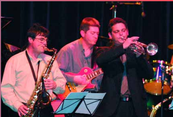
Concert des professeurs de l'école de musique (AMEM) où un programme très éclectique a été présenté