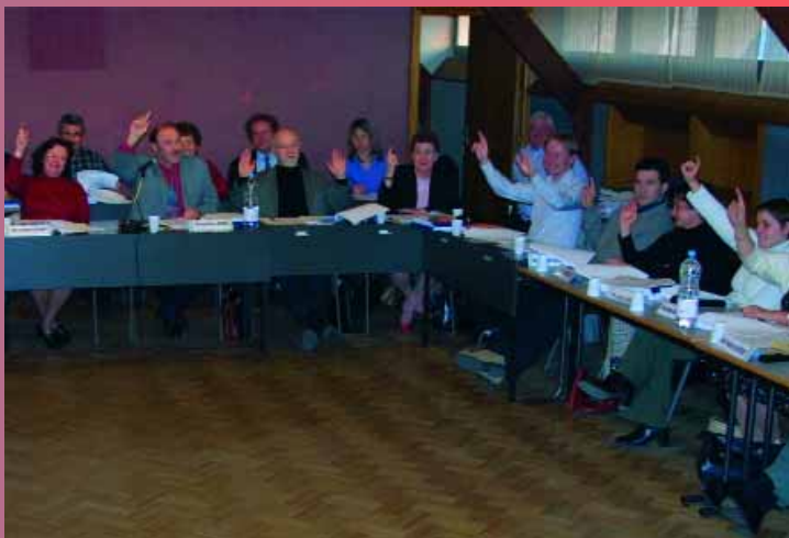
Vote du Budget 2005 par le conseil municipal