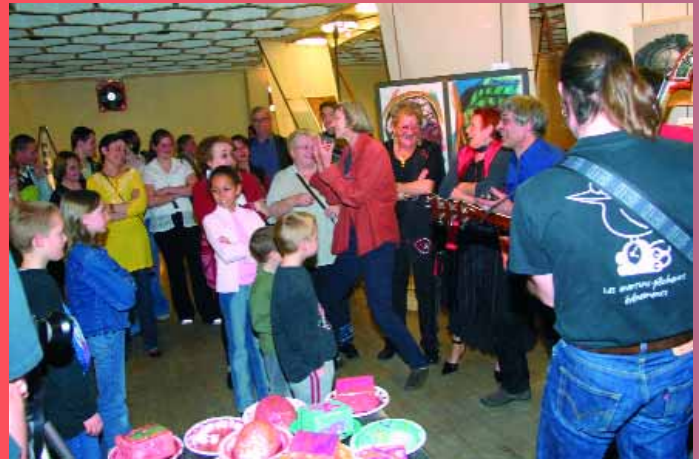
«La soupe à l'art» proposée par l'association «Hors cadre» à la salle de la Libération, avait à son menu, spectacle, exposition et soupe pour tous les visiteurs