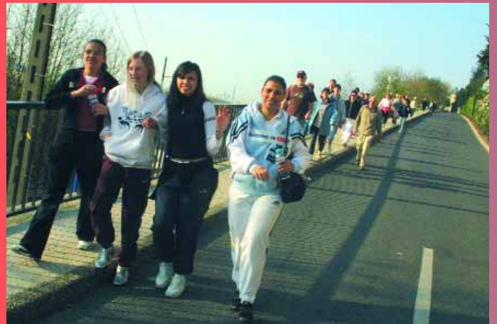
Encore plus de participants cette année pour le «parcours du cœur»