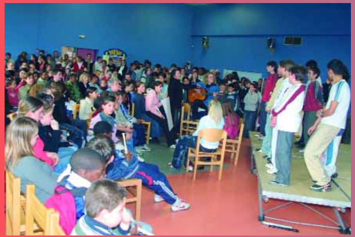
Soirée poésie et musique au collège Anatole France

The Old rap string band ne recule devant rien pour provoquer les éclats de rire. Les 300 spectateurs du Palace ont apprécié