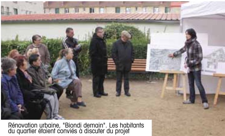
Rénovation urbaine, "Biondi demain". Les habitants du quartier étaient conviés à discuter du projet