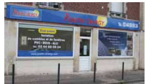
Positive energy (Chauffage et isolation), 74, rue Jean Jaurès