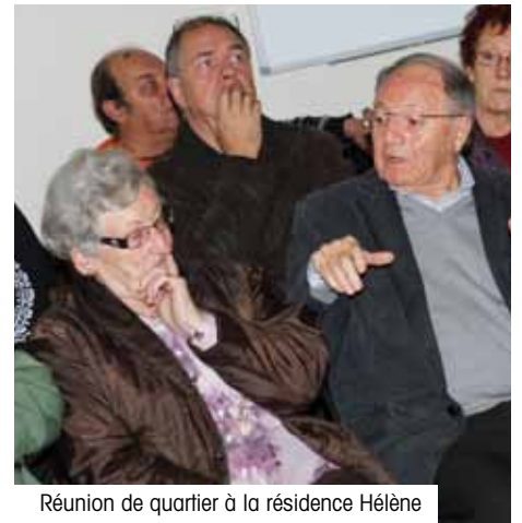
Réunion de quartier à la résidence Hélène

Mais celle-ci a ses limites. Si à partir de 2013, il n'y a pas de nouvelles recettes, la ville sera en déficit. L'urgence est donc à la mobilisation.