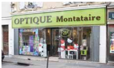
Optique Montataire (opticien), 63, rue Jean Jaurès