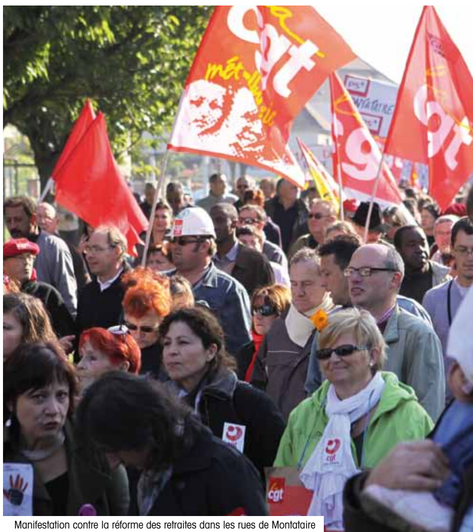
Manifestation contre la réforme des retraites dans les rues de Montataire

services publics, une pression renforcée sur les salaires, le relèvement de l'âge de la retraite. » Mais l'austérité des budgets présentés par les différents pays membres montre que c'est déjà le cas. La politique de démantèlement de l'État social initiée par Bruxelles depuis une dizaine d'années, renforcée par le Traité de Lisbonne au mépris du vote des Français, Irlandais et Hollandais contre le projet de constitution européenne, est désormais en passe d'être atteinte. À moins que les mouvements populaires se poursuivent et prennent de l'envergure. Alors il sera peut-être possible d'enrayer le mouvement.