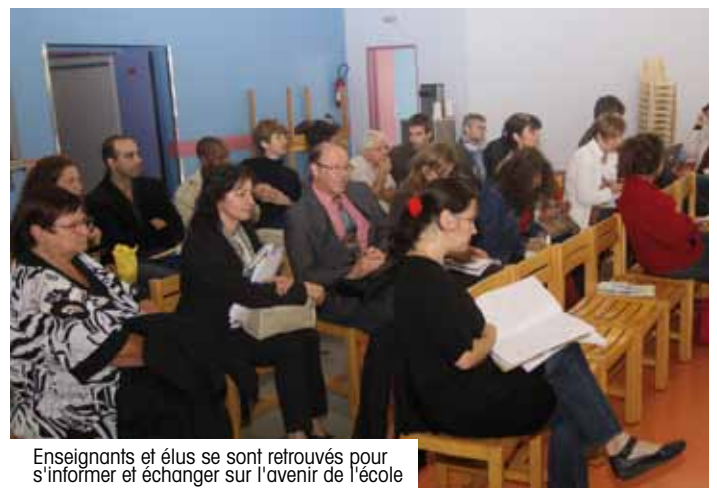
Enseignants et élus se sont retrouvés pour s'informer et échanger sur l'avenir de l'école

L'atelier difficultés scolaires a soulevé de nombreux points : le passage du statut d'enfant au statut d'élève qui pose beaucoup de problèmes, la nature de la difficulté scolaire qui peut avoir des origines diverses (cognitive, psychologique, sociale, médicale). Les participants ont par ailleurs expliqué qu'il était important de comprendre que « l'enfant en difficulté est un enfant en souffrance avec, derrière, une famille qui souffre également ». D'où la nécessité d'aborder le problème de manière très large. Au chapitre des causes pouvant accentuer les difficultés rencontrées par les enfants, les évaluations ont été citées car elles « prennent de plus en plus l'aspect