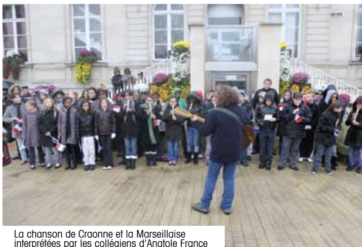
La chanson de Craonne et la Marseillaise interprétées par les collégiens d'Anatole France