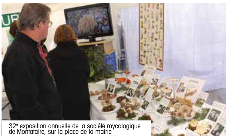
32 e exposition annuelle de la société mycologique de Montataire, sur la place de la mairie