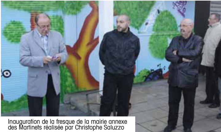
Inauguration de la fresque de la mairie annexe des Martinets réalisée par Christophe Saluzzo