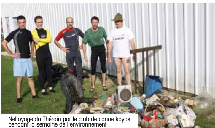
Nettoyage du Thérain par le club de canoë kayak pendant la semaine de l'environnement