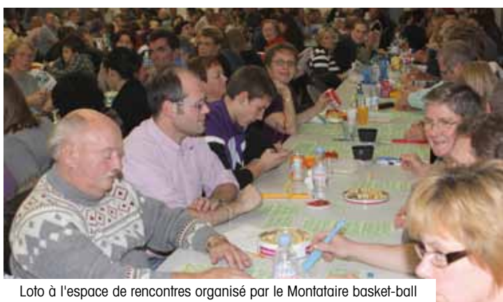
Loto à l'espace de rencontres organisé par le Montataire basket-ball