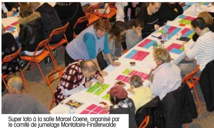
Super loto à la salle Marcel Coene, organisé par le comité de jumelage Montataire-Finsterwalde