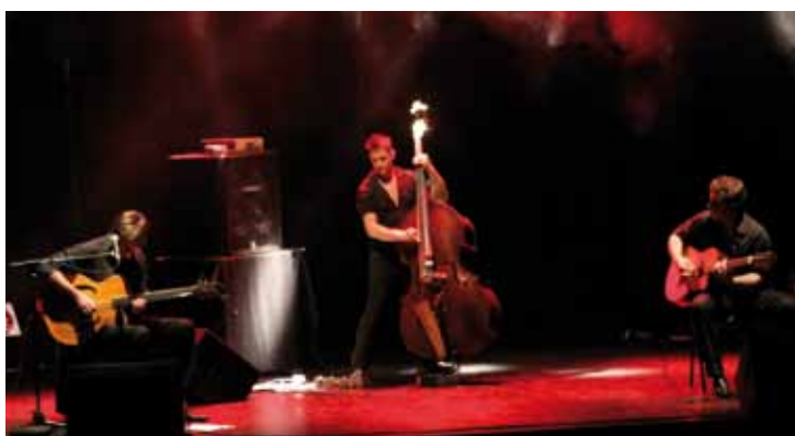
Samarabalouf au Palace, du jazz manouche qui fait penser à Django Reinhardt