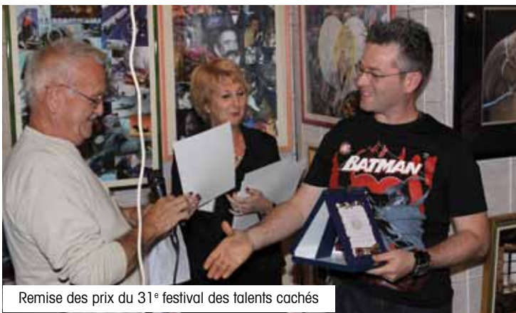
Remise des prix du 31 e festival des talents cachés