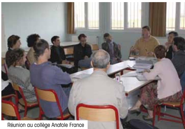
Réunion au collège Anatole France

L'atelier école et fonds publics : il a été souligné la baisse des effectifs dans certains collèges en raison de la suppression de la carte scolaire. Les parents qui en ont les moyens envoient en effet leurs enfants ailleurs. Pour les participants, il est évident « que l'affaiblissement du service public est un atout pour le privé. » Ils ont ainsi évoqué la décision du département de la Somme de financer les établissements privés, espérant que l'Oise lui emboîte le pas. Il a été également souligné la baisse de la scolarité