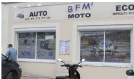
BFM (auto-école), 14, rue de Condé