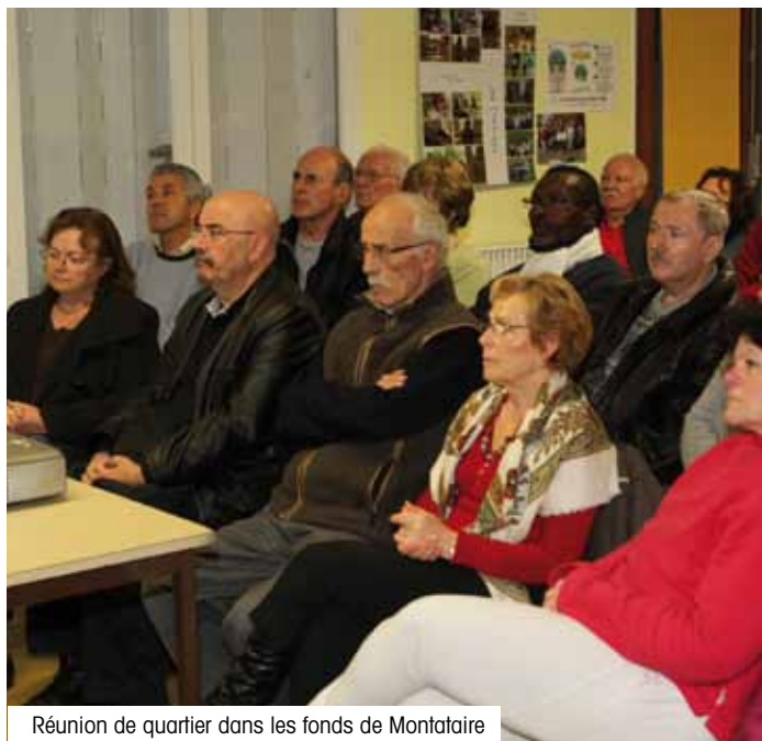
Réunion de quartier dans les fonds de Montataire

Malheureusement la participation n'est pas toujours à la hauteur des enjeux. Or c'est un outil dont les habitants devraient se saisir pour faire entendre leur voix.