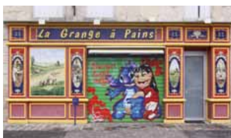
La grange à pains (boulangerie), 11, rue de la république

Si des commerçants sont oubliés, qu'ils n'hésitent pas à le signaler aux services techniques en appelant le 03 44 64 45 45.