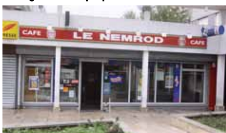
Le Nemrod (bar-tabac), avenue Anatole France