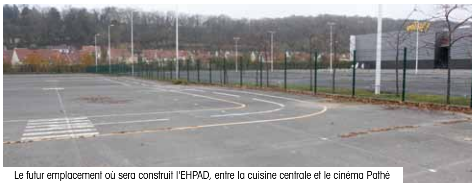
Le futur emplacement où sera construit l'EHPAD, entre la cuisine centrale et le cinéma Pathé

Le Conseil municipal s'est donc adressé au Président du Conseil général de l'Oise et au Directeur de l'Agence régionale de santé pour que son rang soit maintenu sur la liste d'attente.