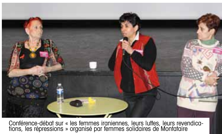
Conférence-débat sur « les femmes iraniennes, leurs luttes, leurs revendications, les répressions » organisé par femmes solidaires de Montataire