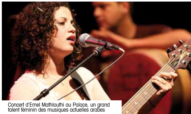
Concert d'Emel Mathlouthi au Palace, un grand talent féminin des musiques actuelles arabes