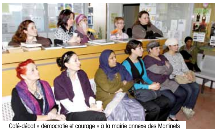
Café-débat « démocratie et courage » à la mairie annexe des Martinets