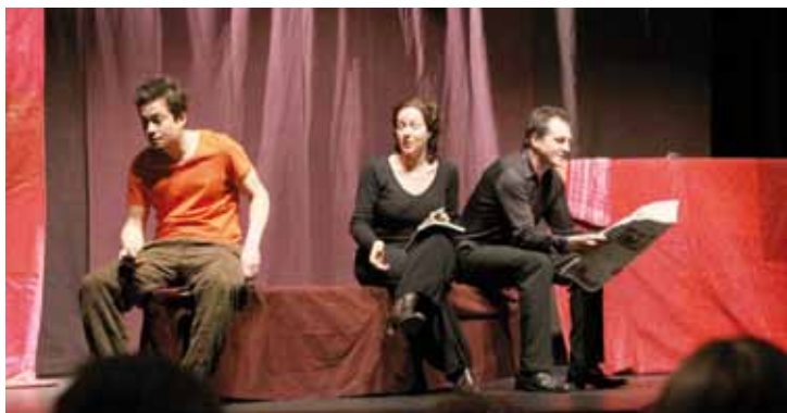
« Comment parler avec des adolescents » spectacle - débat proposé par le collège Anatole France et le lycée André Malraux