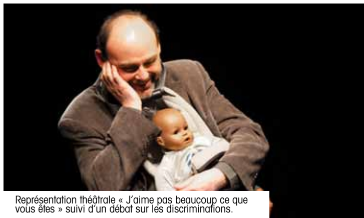
Représentation théâtrale « J'aime pas beaucoup ce que vous êtes » suivi d'un débat sur les discriminations.