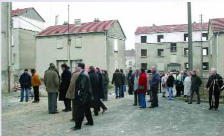
Les anciens habitants sont venus une dernière fois dans la cité où ils ont vécu pour certains plusieurs décennies. Beaucoup d'émotions lors de cette réception.