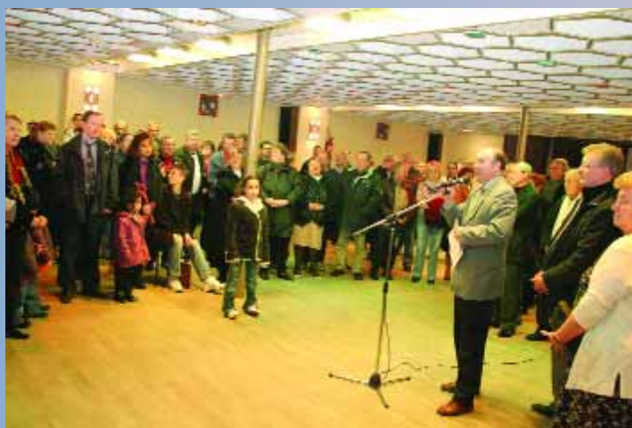
Réception de remise des prix aux lauréats du concours des illuminations 2005. Toutes les personnes ayant participé ont été récompensées et recevront une copie du DVD enregistrée par Vidéo-travelling