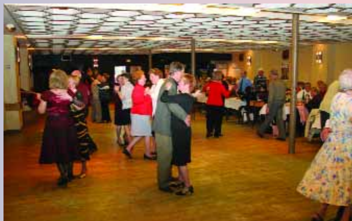
Symphatique et fraternelle ambiance au repas annuel des retraités de la CGT