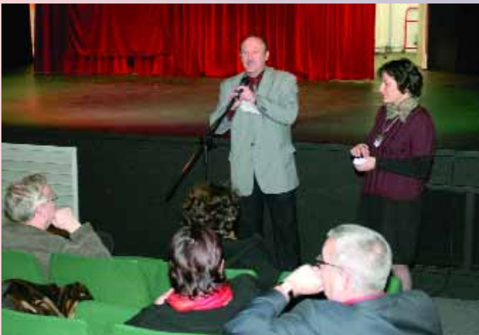
M. le Maire a annoncé la réouverture du Palace, après des travaux, qui ont sensiblement amélioré les installations scéniques