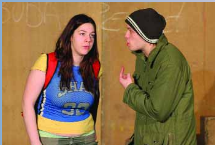
3210 du Zététique théâtre au Palace, une histoire d'amour interprétée par deux jeunes comédiens talentueux