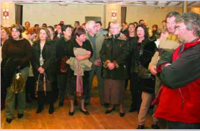
Vœux de M. le Maire et de la municipalité aux agents de la ville