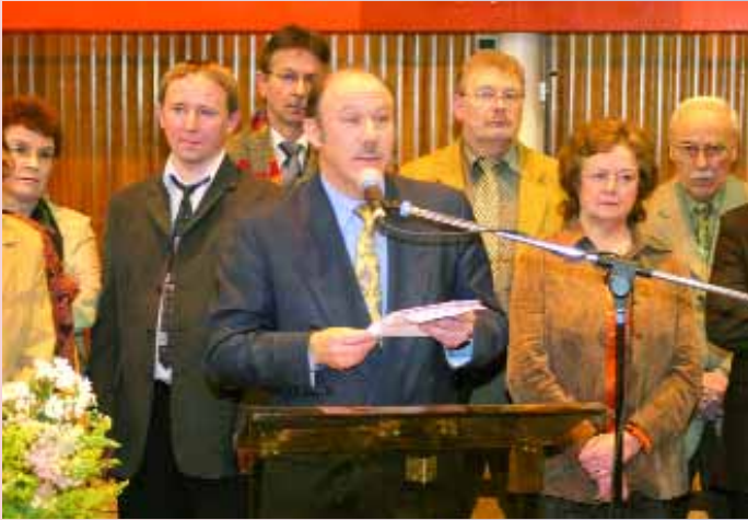
Vœux de M. le Maire et de la municipalité aux personnalités