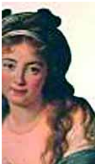
Olympe de Gouges, l'une des premières militantes féministes qui pendant la révolution de 1789 lutta pour l'égalité entre les hommes et les femmes

Alors que les femmes représentent aujourd'hui 20 % des diplômés toutes filières confondues, elles