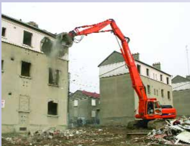
Premiers coups de pelleteuse pour la démolition des immeubles. La reconstruction sera achevée fin 2007 en préservant le caractère de cité-jardin et en favorisant la mixité sociale