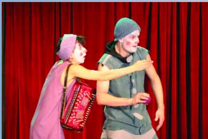
Yapa K'toi par la compagnie Tellem Chao, un spectacle sans paroles, qui a parlé de la différence, de la tolérance et de l'acceptation, au Palace