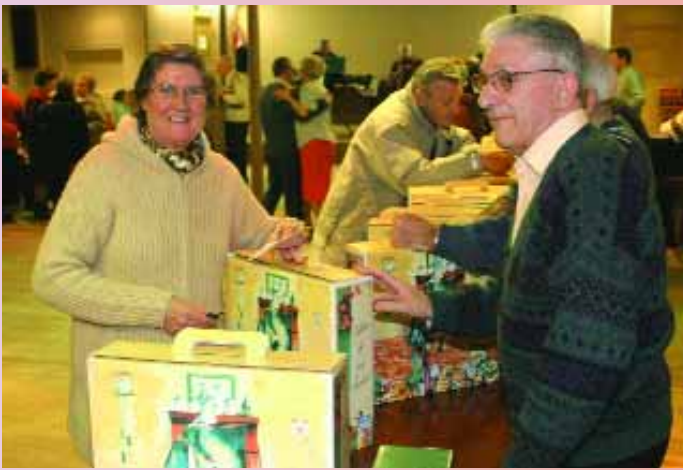
Traditionnelle remise des colis de la Municipalité aux retraités