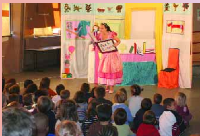
Le 16 novembre, à l'école Joliot Curie, fut l'occasion de fêter les droits de l'enfant