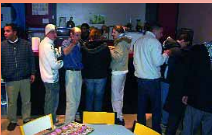
Nuit de la Saint Sylvestre, bonne ambiance avec des jeunes de Montataire qui ont organisé une soirée amicale avec les habitants dans le cadre du fonds de participation des habitants. Par ailleurs, le soir même, l'association des Maghrébins a organisé une rencontre de foot en salle au complexe Marcel Coene