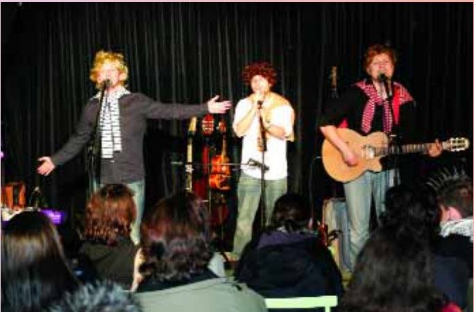
Il était impossible d'être triste, avec Oldelaf et Monsieur D, de la chanson qui fait rire et taper du pied, les spectateurs ne s'en sont pas privés