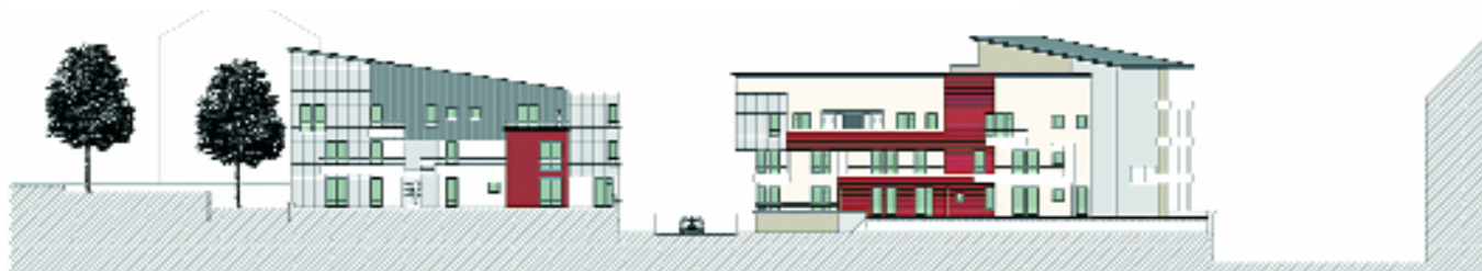
Façade Sud - Projet de reconstruction

d'ailleurs parler de déconstruction et non de démolition. Quelle différence ? Et bien le premier terme signifie que tous les matériaux qui avaient servi à la construction de la cité dans les années trente, date des premiers logements sociaux, vont être démontés les uns après les autres pour être triés et recyclés. Oise-Habitat avait déjà expérimenté cette procédure, écologique, lors de la démolition, non pardon, lors de la déconstruction de la Lingerie de Creil. C'est désormais la loi qui impose ce procédé pour mieux