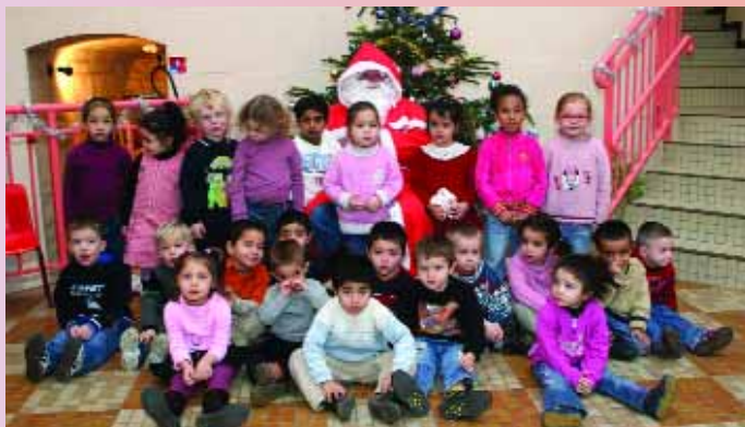
Visite du Père Noël dans les écoles maternelles où un jouet est offert pour chaque enfant par la Municipalité