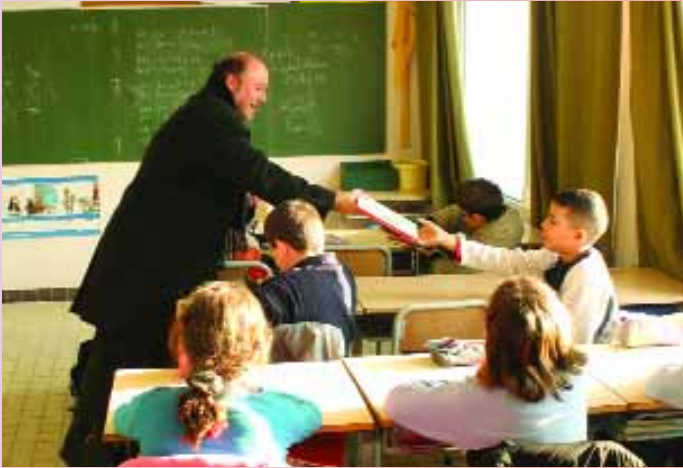
M. le Maire remet à un élève le livre offert à chaque enfant des écoles élémentaires pour Noël