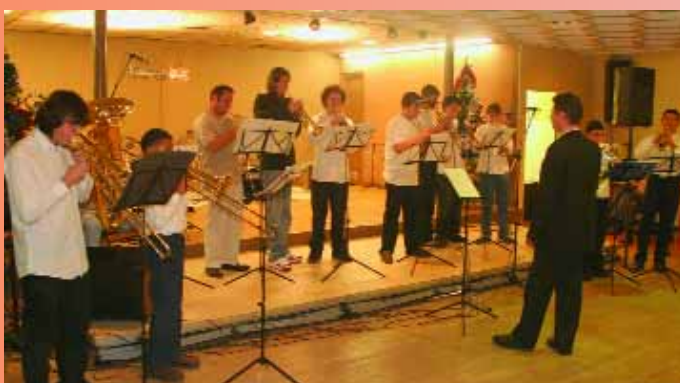
Démonstration des élèves de l'école de Musique de Montataire (AMEM) pour fêter la fin de l'année