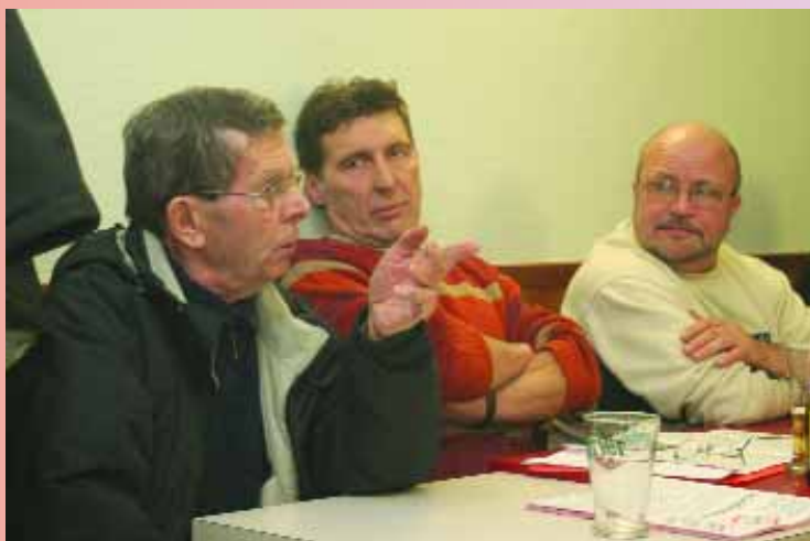
Débat au café des sports à Montataire «Et le travail ? parlons en !» organisé par l'association La Forge et le service culturel