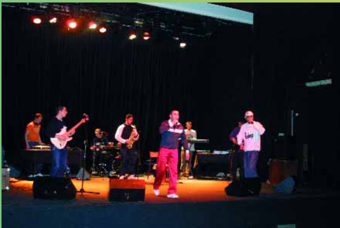
Scène ouverte aux jeunes talents, le groupe «Ma version» était sur les planches du Palace le 19 décembre