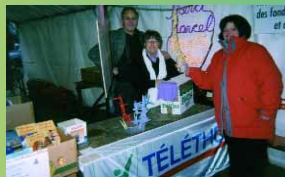
Les adhérents de l'association en pleine action lors du Téléthon

Un dynamisme qui fait de ce quartier l'un des plus actifs de la ville.