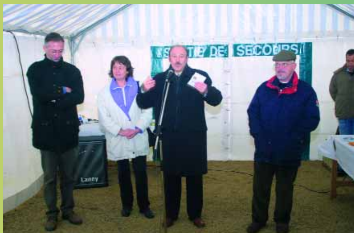
M. le Maire de Montataire avec à ses côtés les représentants de Thiverny, de Granulats de Picardie et des «Martins-pêcheurs» s'est félicité d'une coopération qui a favorisé l'environnement