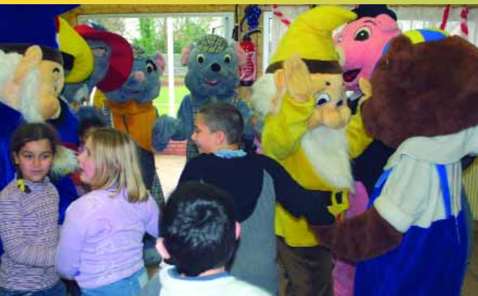
A l'initiative de la municipalité, des peluches vivantes ont rendu visite aux enfants du centre aéré, avant d'animer les rues et les commerces de Montataire