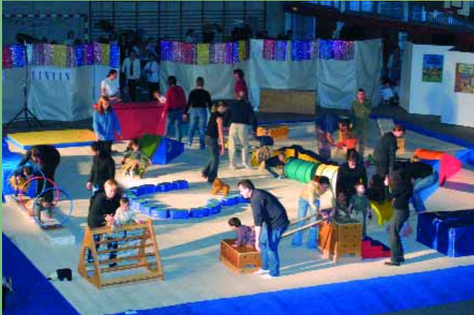
Traditionnelle fête de fin d'année à la salle Marcel Coene de l'association de gym «Espérance Municipale de Montataire» qui fêtera son centenaire en 2005