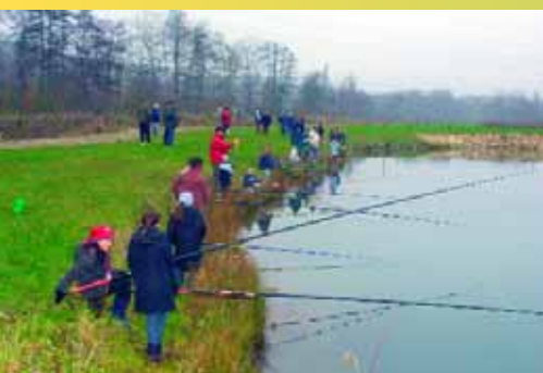
Les enfants des écoles se sont initiés à la pêche à ligne au bord de l'étang avec l'aide des membres de l'association des «Martins-pêcheurs»

Samedi 11 décembre, le parc urbain du Prieuré a été inauguré par la municipalité, la société Granulats de Picardie et les membres de l'Association des Martins Pêcheurs qui le gère en collaboration avec le