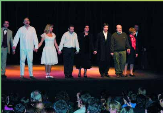
Une salle bien garnie a accueilli la compagnie «théâtre amateur» pour la représentation de William Pig de Christine Blondel