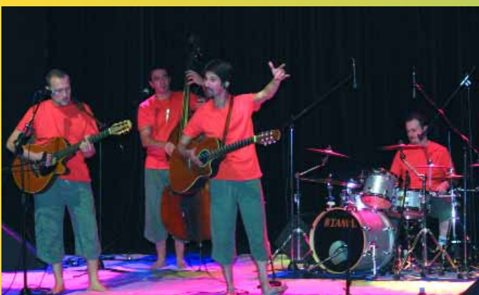
Le groupe «Bacs à sable» a emmené les petits spectateurs du Palace dans leurs aventures extraordinaires