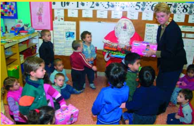
Le Père Noël en tournée dans notre ville a rencontré les enfants des écoles maternelles