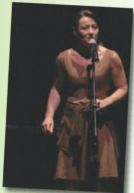
Stabat mater furiosa, au Palace, un spectacle poétique et musical contre la guerre.