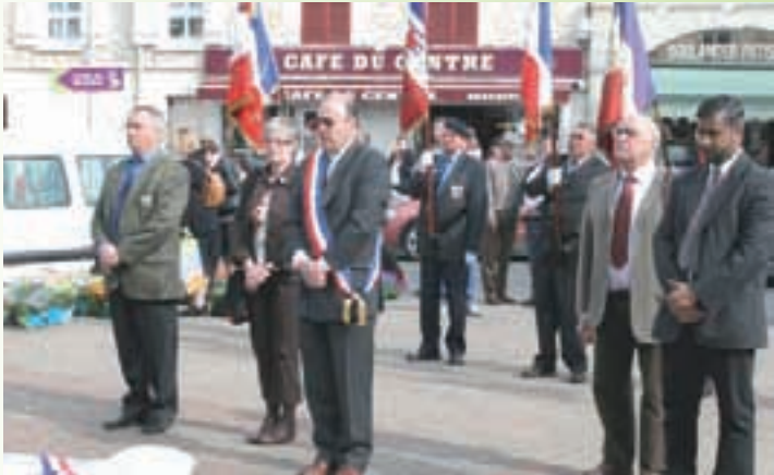
Cérémonie commémorant le 63 ème anniversaire de la Libération des camps