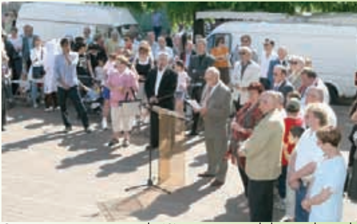
Cérémonie commémorative du 63 ème anniversaire de la capitulation de l'Allemagne nazie