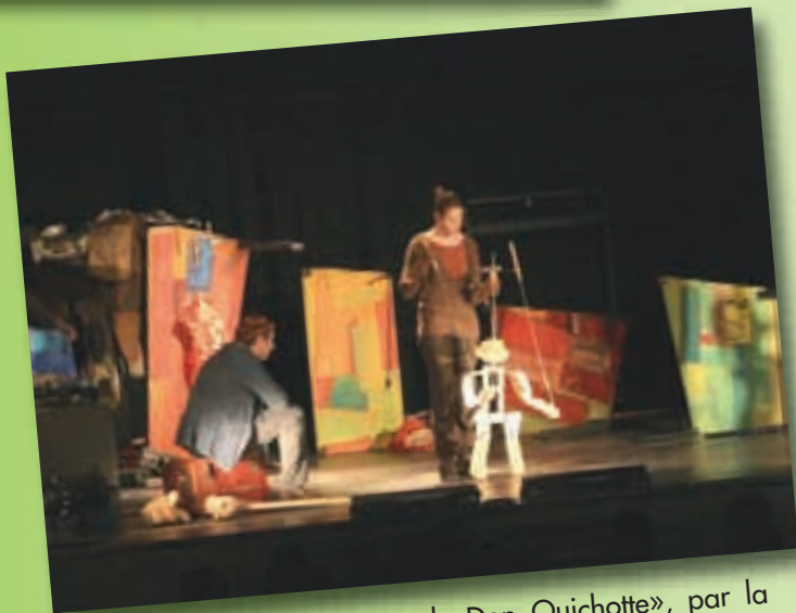
Théâtre au Palace «Retours de Don Quichotte», par la compagnie «Chespanses vertes».