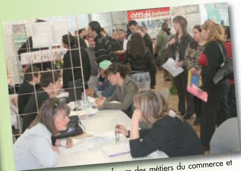
Beaucoup de visiteurs au forum des métiers du commerce et de la restauration, à l'Espace de rencontres.