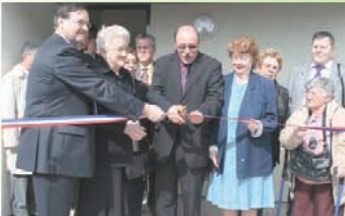
Inauguration de l'opération de 41 logements en lieu et place de la cité Jules Uhry, en présence d'anciens habitants.