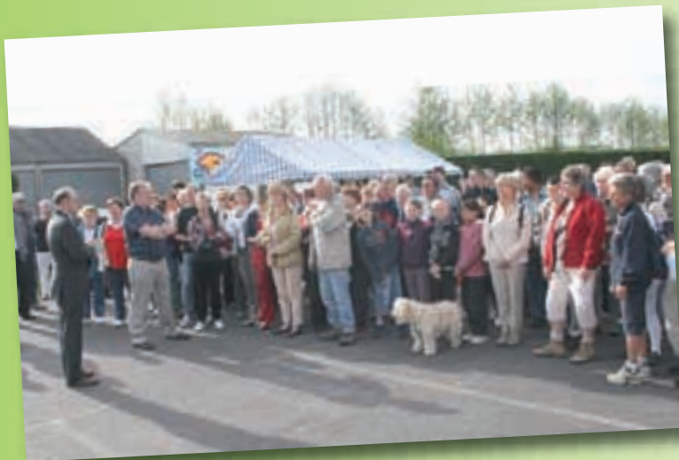
Monsieur le Maire et Monsieur Boyer, adjoint aux sports, ont donné le départ du parcours du cœur.