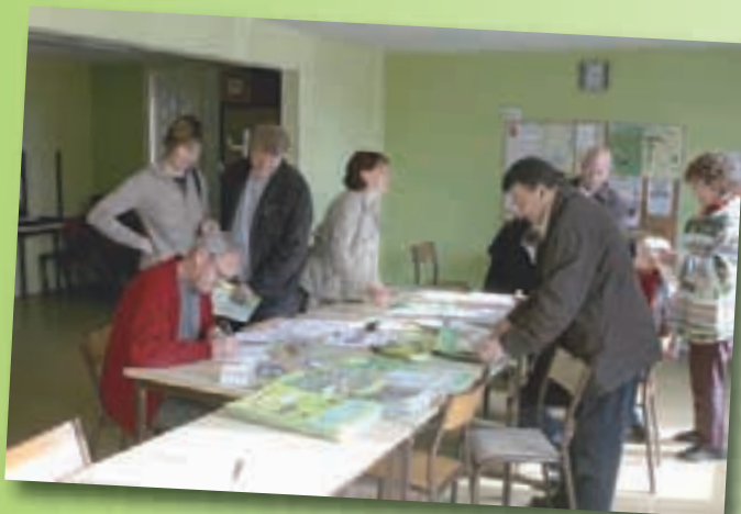
Distribution des composteurs dans le quartier des fonds de Montataire.