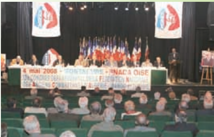
33 ème congrès départemental de la FNACA (Fédération Nationale des Anciens Combattants d'Algérie) dans la salle du Palace de Montataire