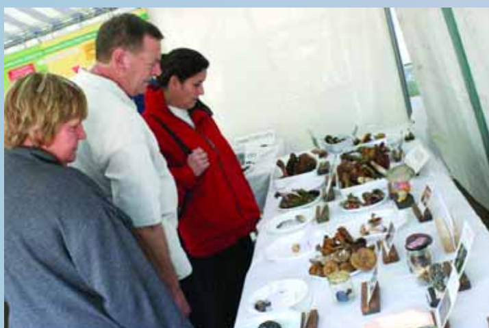
Découverte des champignons sur le marché, exposition organisée par les mycologues de Montataire