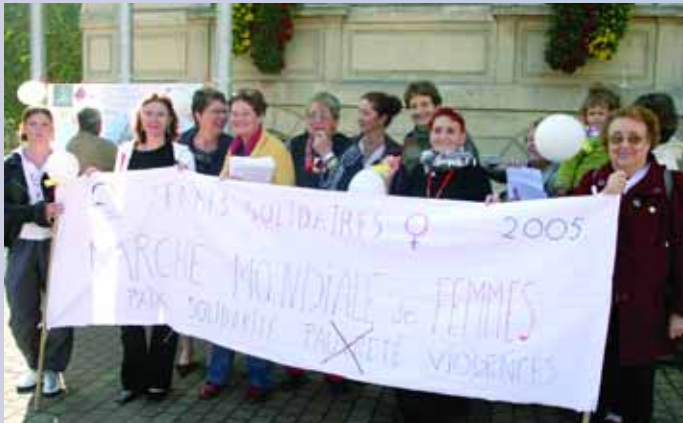
Rassemblement sur la place de la Mairie de l'association «Femmes Solidaires» pour soutenir la marche mondiale des femmes