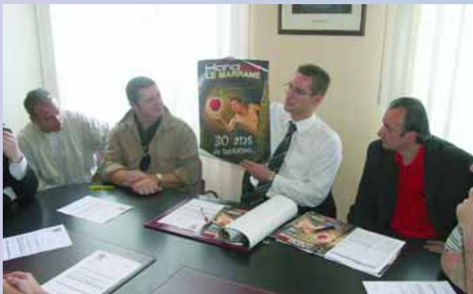
Grâce à l'action des dirigeants et des bénévoles, le club de handball de Montataire a signé l'organisation du match Portugal-Pologne avec le directeur du challenge Marrane. Ce match aura lieu le 7 janvier au gymnase Marie Curie de Nogent sur Oise