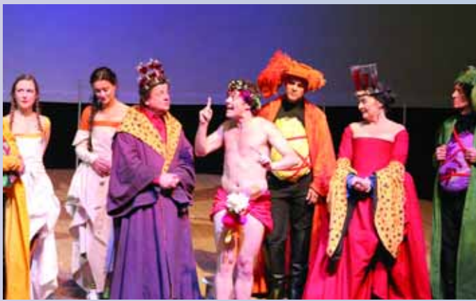
«La très mirifique épopée Rabelais» par la troupe des Tréteaux de France. Un spectacle sous chapiteau signé Marcel Maréchal