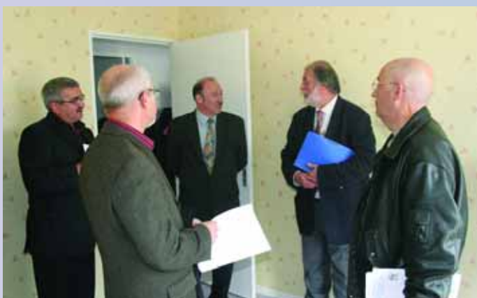
Visite de l'appartement témoin de la Résidence du «Clos des Remparts» avec M. le Maire et les élus. Cette résidence située au 178, rue Jean Jaurès sera livrée au premier trimestre 2006 et compte 13 logements