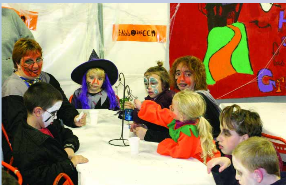
La fête d'Halloween au Petit Château, monstres, vampires et autres étaient de sortie. Même les chaises ont été transformées couleur citrouille !