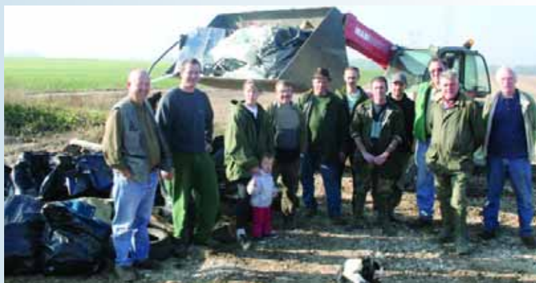
Les chasseurs ont aussi participé au nettoyage de la forêt et des chemins forestiers