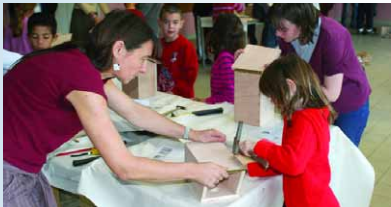
L'hiver approchant, des élèves de l'école Joliot Curie construisent, avec l'aide des élèves de la Section Segpa du collège, des petits refuges pour les oiseaux.