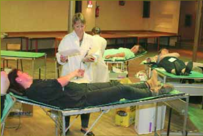
Le 3 octobre dernier, de nombreux Montatairiens se sont rendus à la salle de la Libération pour donner leur sang. Leur action permettra de sauver des vies. La prochaine collecte aura lieu le lundi 19 décembre de 15 h à 19 h au même endroit.