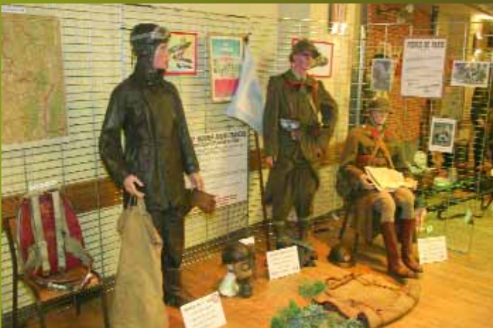
Exposition sur la guerre 39-45 à la salle de la Libération organisée par le club du Souvenir militaire rassemblant documents, affiches, costumes et matériels d'époque.