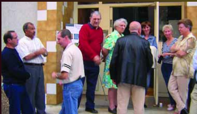
Signature de la charte d'escalier entre les locataires du 23, rue Gabriel Péri et Oise-Habitat