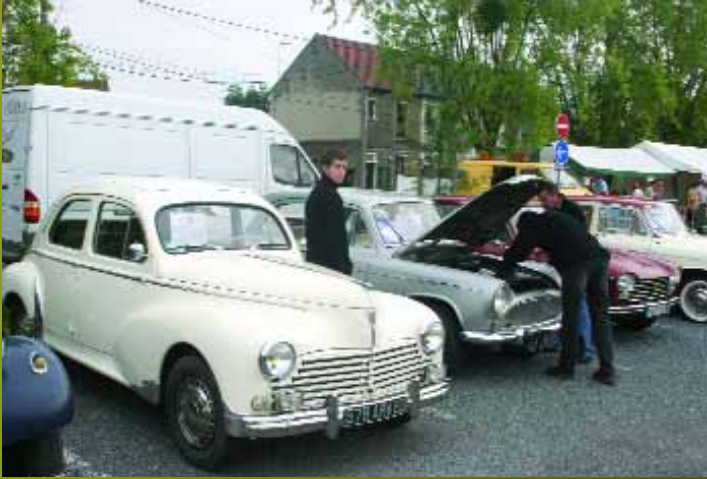
L'Association Montatairienne des Véhicules Anciens est présente tous les quatrièmes dimanches du mois près du parking du cinéma Pathé.