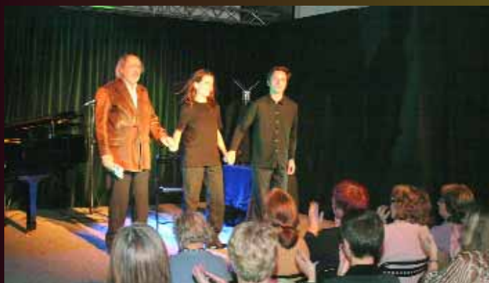
Belle soirée d'ouverture de la saison culturelle avec une pièce d'Alessandro Barrico «Novecento» jouée exceptionnellement à la Chapelle, école Jean Jaurès, en raison des travaux au Palace

L e 4 octobre, des millions de salariés ont massivement cessé le travail et ont manifesté leur colère. Soutenus par la très grande majorité de nos concitoyens, leurs actions étaient motivées par la défense de l'emploi et du pouvoir d'achat, celle de nos entreprises industrielles et de nos services publics. Plus de 1000 chômeurs à Montataire dont de très nombreux jeunes, la suppression de centaines d'emplois industriels, les graves menaces qui pèsent sur l'emploi des services publics avec les orientations gouvernementales de restrictions des dépenses de l'Etat, une fiscalité de plus en plus injuste : c'est inadmissible !