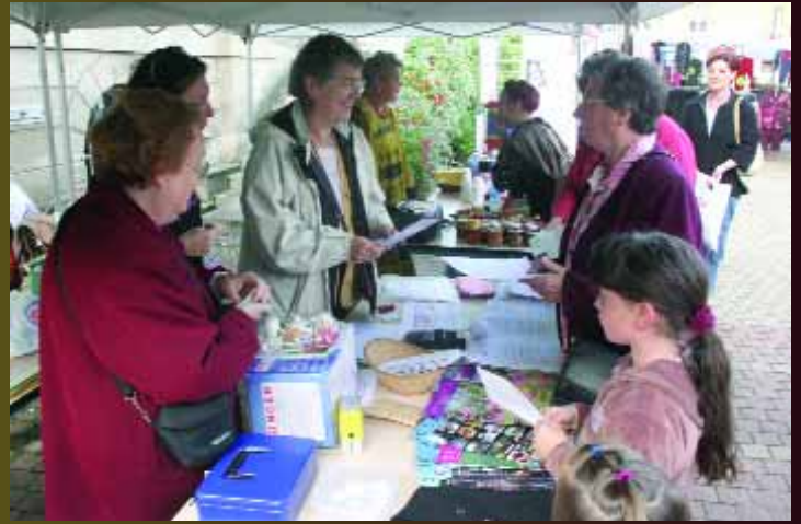
L'association «Femmes Solidaires» a présenté son projet de création d'un centre d'accueil et d'informations en Ethiopie contre l'excision des petites filles et prépare son 60ème anniversaire.