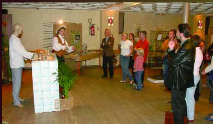
Inauguration de la fête du livre, avec une très belle exposition sur la «route du cacao» organisée par le service municipal de la lecture publique et des bibliothèques