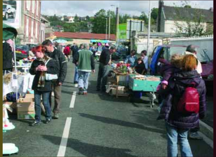
Le Comité des fêtes a organisé sa brocante annuelle rue des Déportés.