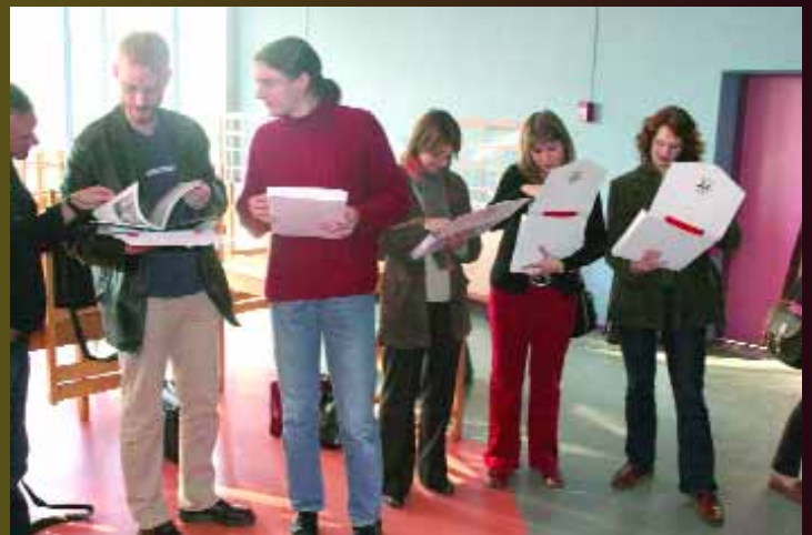
Réception des nouveaux enseignants au Collège Anatole France. Accueillis par M. le Maire, ils ont reçu chacun la mallette d'informations sur notre ville. Avec tous nos souhaits de bonne année scolaire et d'encouragements pour leur mission au service de l'éducation des jeunes.