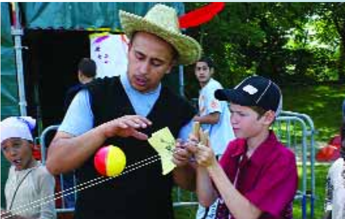
Une belle journée en famille pour la fête des centres de loisirs