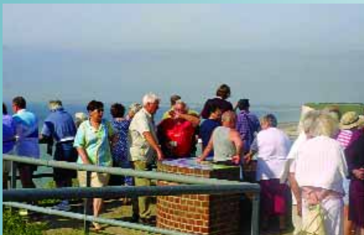
Voyage annuel des retraités au Tréport