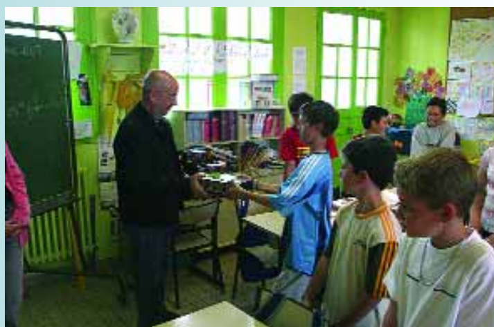
Comme chaque fin d'année scolaire, la municipalité a offert un dictionnaire aux enfants du CM 2