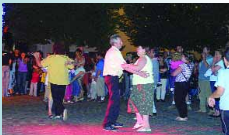
Bonne ambiance au bal du 14 juillet, place de la Mairie