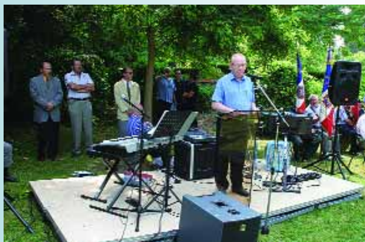
Une journée à la campagne chez Henri Barbusse, à Aumont-en-Halatte en hommage à l'écrivain pacifiste