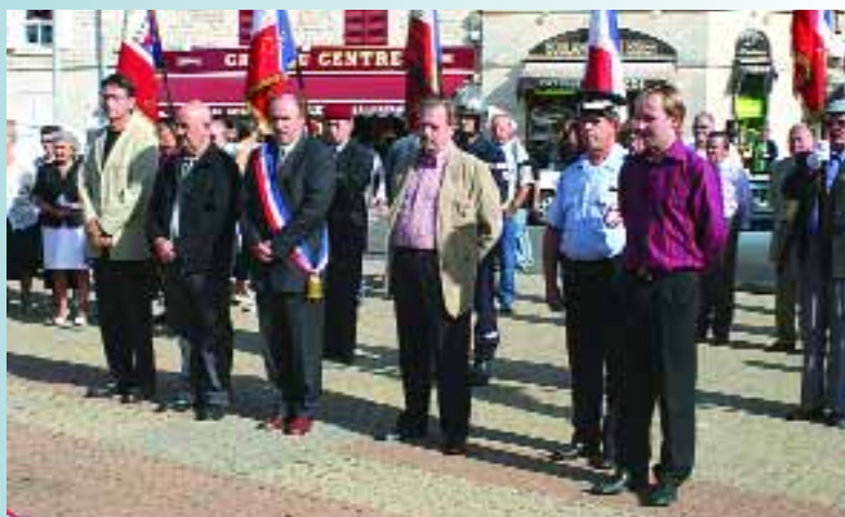
Cérémonie de la libération de la ville de Montataire