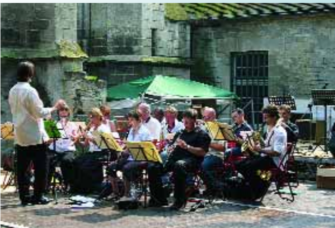
Un beau plateau musical pour les 15 ans de l'AMEM sur le site de l'église Notre-Dame