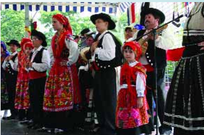
Festival folklorique organisé par le «Souvenir du Portugal»