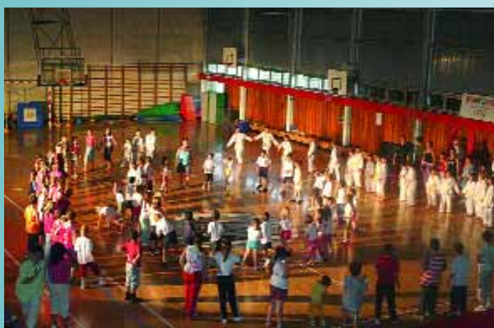
Journée de clôture de la 10ème ronde des sports