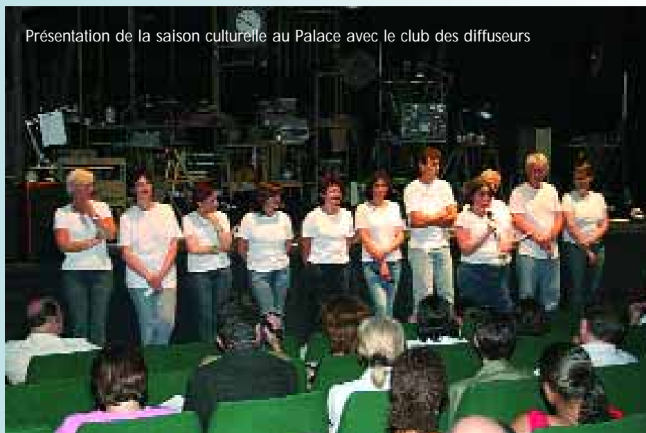
Présentation de la saison culturelle au Palace avec le club des diffuseurs