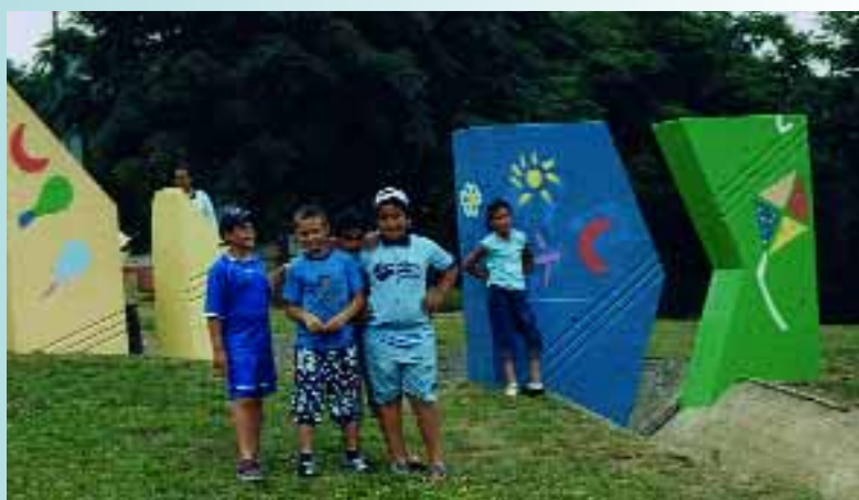
Réalisation et inauguration des «Menhirs», quartier des Martinets, par les enfants du centre de loisirs