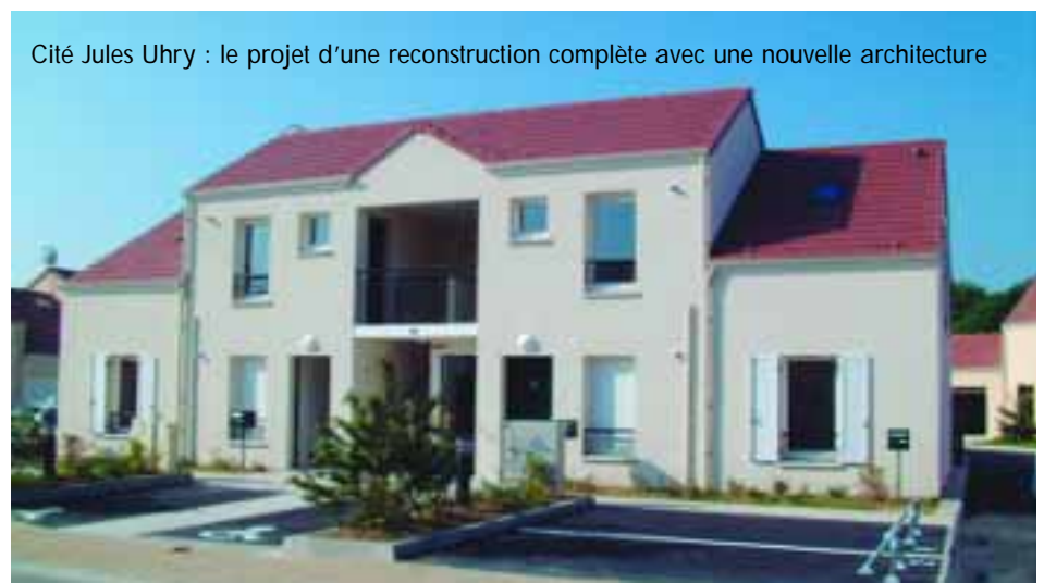
Cité Jules Uhry : le projet d'une reconstruction complète avec une nouvelle architecture

draît à réduire à néant les moyens, humains et matériels, mis en œuvre depuis quinze ans par les organismes HLM, la mairie et d'autres partenaires pour réhabiliter ces logements et leur donner ainsi un niveau de confort supérieur à ce qui pourrait être construit aujourd'hui. De plus, il serait impossible de reconstruire l'équivalent des logements existants, donc de reloger la totalité des habitants concernés. Ce qui contraindrait un certain nombre d'entre eux à quitter la ville. Or, dans ces quartiers tant décriés, les gens ont tissé, au fil des années, des liens d'amitié et de solidarité auxquels ils restent très attachés. Une étude de satisfaction