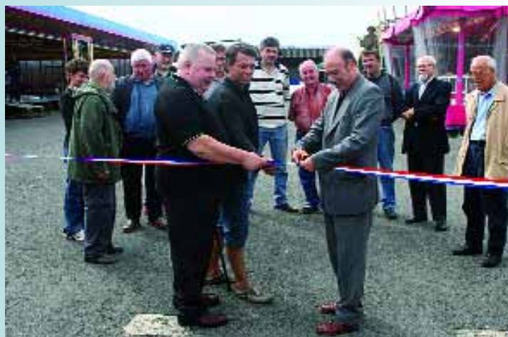
Inauguration de la fête communale avec Monsieur le Maire, le président du comité des fêtes et le représentant des forains