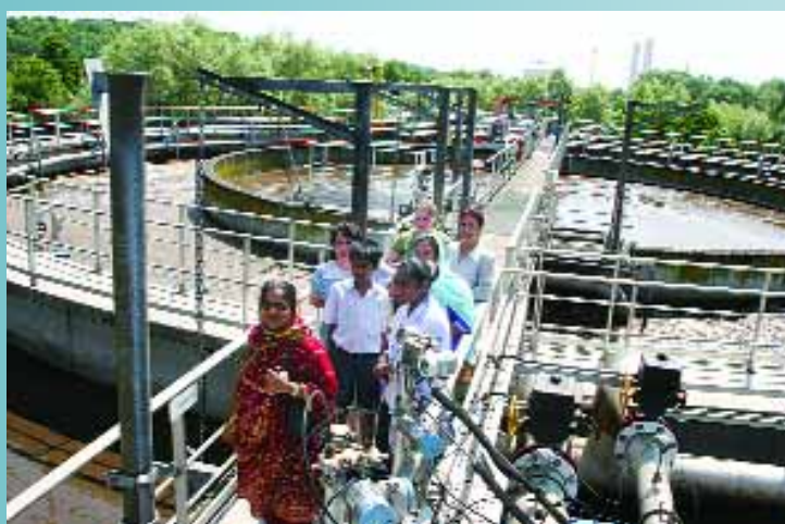
Visite organisée par la maison Huberte d'Hoker à la station d'épuration de la communauté d'agglomération qui se situe sur le territoire de Montataire le long de l'Oise