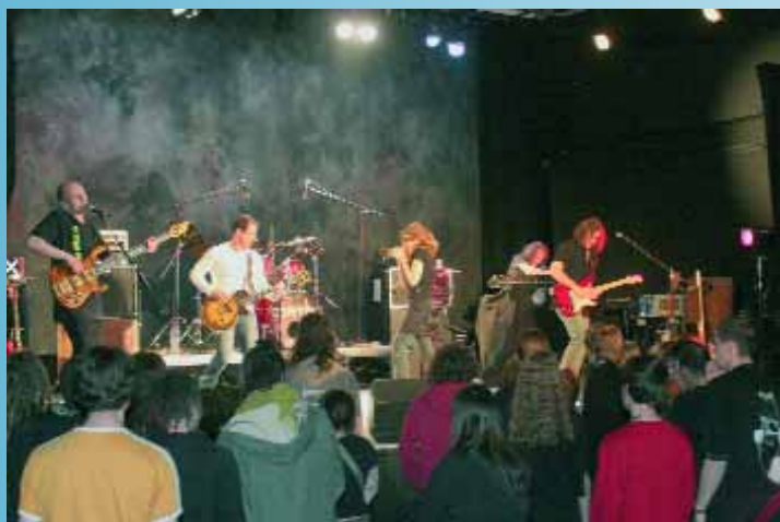
Le groupe Osmo'z au Palace, un rock planant avec une belle voix féminine, pour le plaisir des spectateurs venus très nombreux