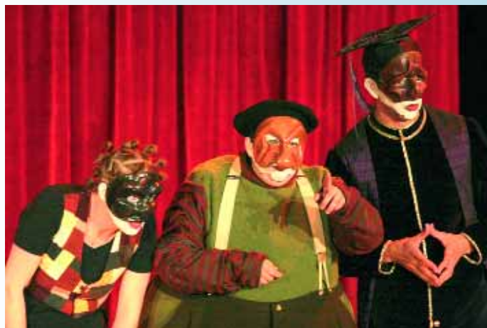
Soirée réussie à entendre les spectateurs hurler de rire dans la salle du Palace, pour la pièce le «Cid all'improviso» de la compagnie Jocker; librement inspiré de la tragi-comédie de Monsieur Corneille