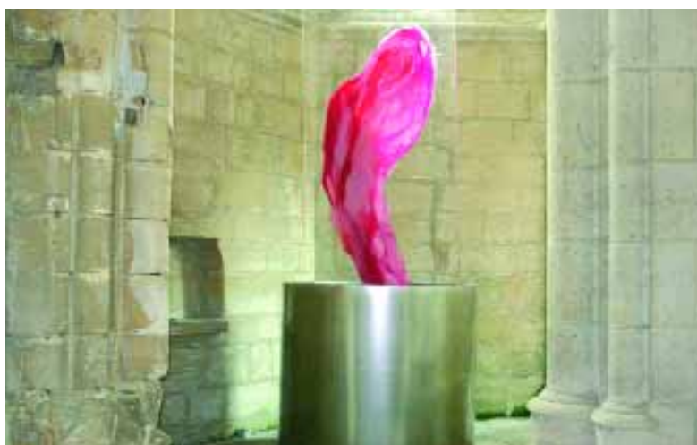
Les puits du Désir