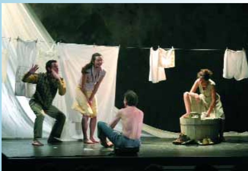
La compagnie Chenevoy a présenté aux spectateurs du Palace la pièce de Suzanne Lebeau «Salvador, la montagne, l'enfant et la mangue»