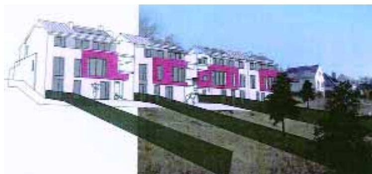
Projet des Chères Vignes

L'ensemble de ces travaux ont été réalisés par la SA Guillou, exceptées les barrières de sécurité qui l'ont été par Clôture environnement.