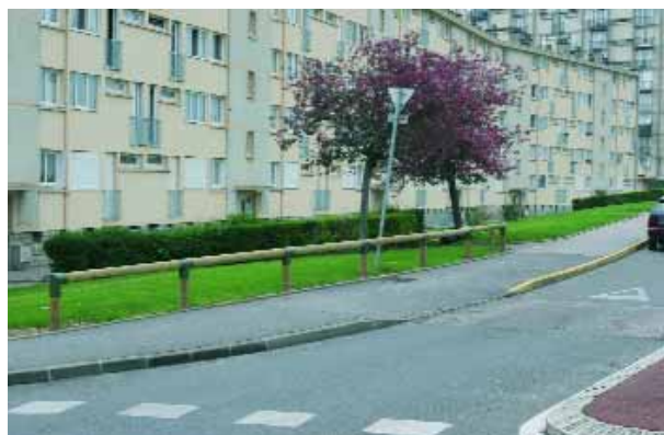
Rond-point Anatole France-Gabriel Péri