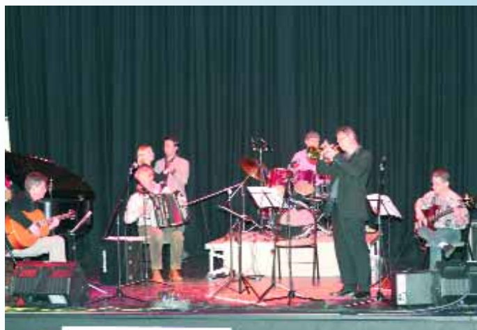
Traditionnel concert des professeurs de l'AMEM, c'était une belle occasion de venir écouter sur scène un répertoire varié