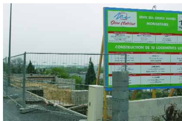
Chantier des Chères Vignes

Après deux ans, il sera possible aux occupants de les acheter. Le coût de cette opération s'élève, pour le bailleur social, à 1 500 000 euros. La ville y a contribué en vendant à Oise Habitat le terrain à un prix inférieur à celui pratiqué sur le marché.