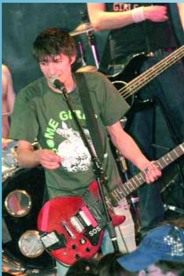
Le groupe Guérilla Poubelle a électrisé les 300 spectateurs du Palace, avec sa musique énergique et puissante