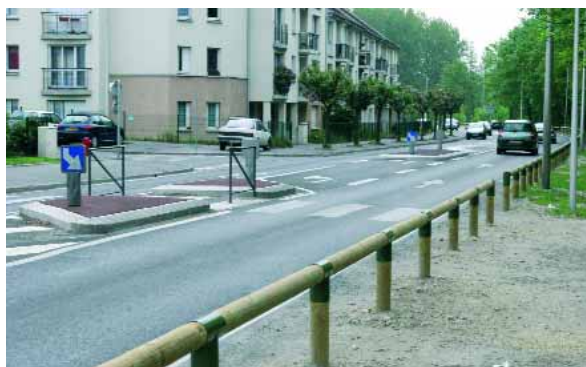
Avenue de la Libération

Les barrières, longues de 2,25 m. sont en pin traité. Le coût de ces travaux s'élève à 17.000 € TTC. Le même type de barrière a été posé avenue Anatole France à la hauteur du rond-point de la piscine pour empêcher les stationnements sur les espaces verts.