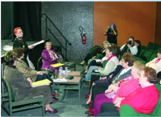
Conférence-débat «la précarité des femmes», au Palace organisée par Femmes Solidaires de Montataire