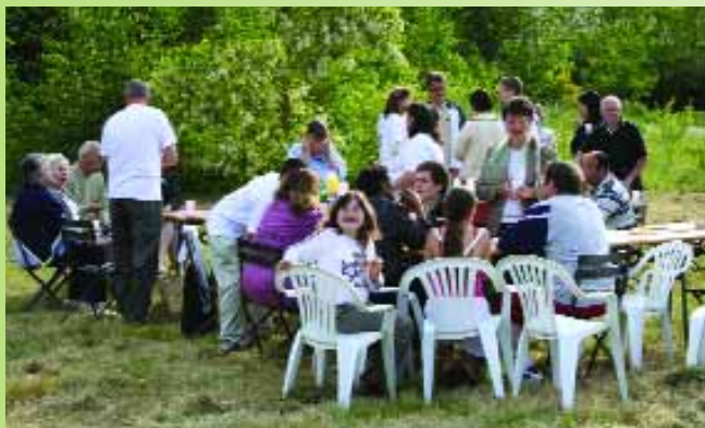
Aux Fonds de Montataire