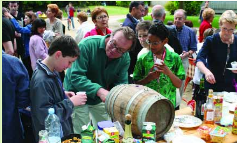
A la Résidence Hélène