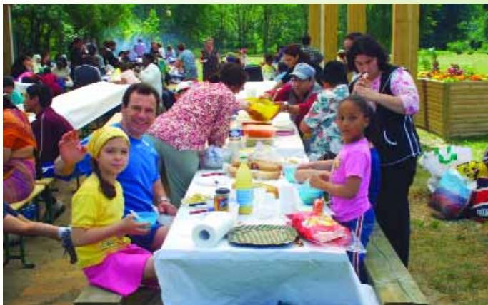
Superbe ambiance au repas annuel de la journée internationale des familles à la base de loisirs intercommunale, organisé par le service social municipal et la maison sociale Huberte d'Hoker. Monsieur le Maire est venu saluer les convives