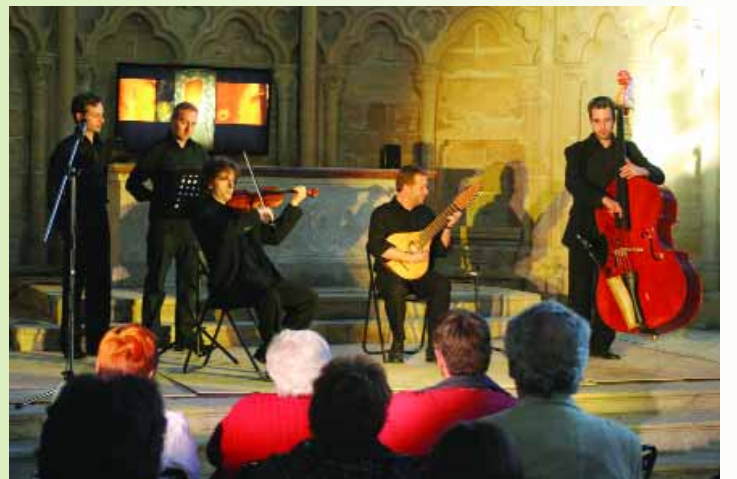
Le célèbre groupe corse «Sarochi» a ensoleillé l'église Notre-Dame de leurs voix rares et authentiques