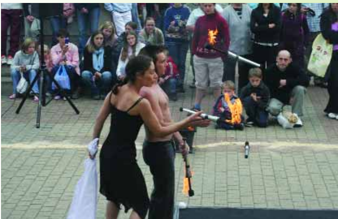
Spectacle sur le marché par la compagnie Freddo et Léo, un duel chorégraphique de danse et de jonglerie de feu