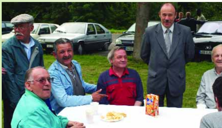
Au foyer Aftam