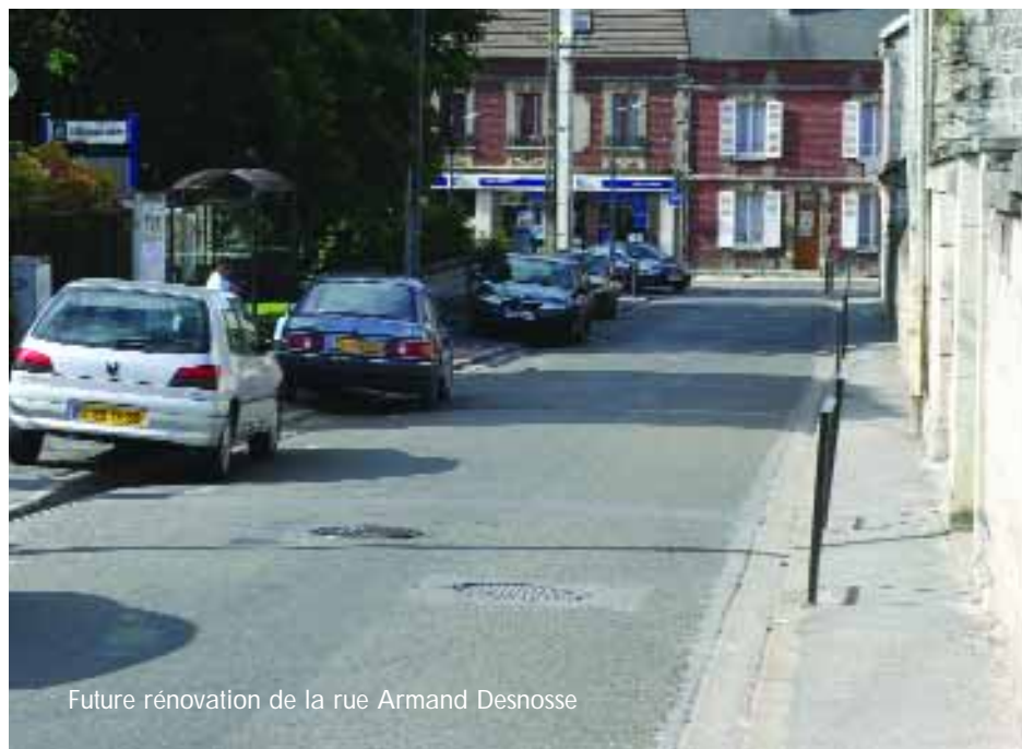
Future rénovation de la rue Armand Desnosse

Même pendant l'été, la vie municipale continue. La période estivale est en effet propice à la réalisation de nombreux travaux d'entretien, de rénovation et de réaménagement du domaine public.