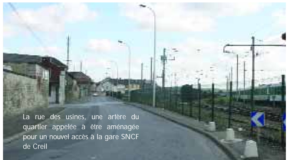
La rue des usines, une artère du quartier appelée à être aménagée pour un nouvel accès à la gare SNCF de Creil