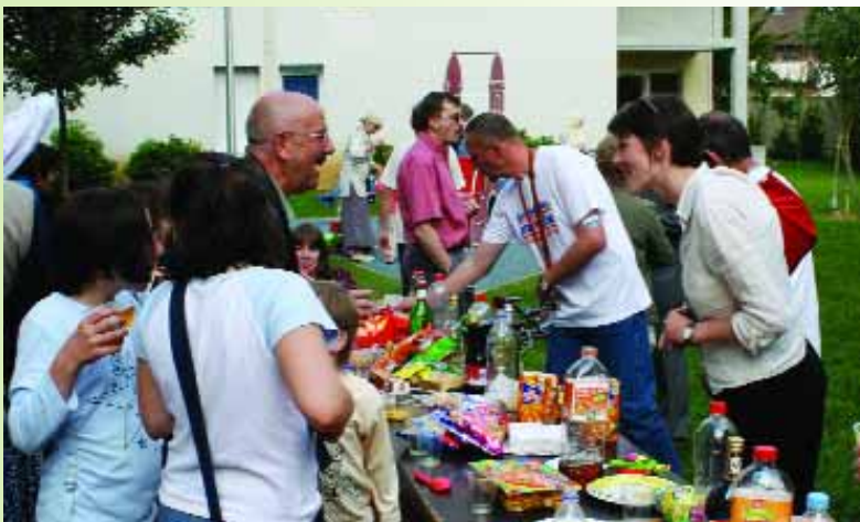
Au quartier Lesieur