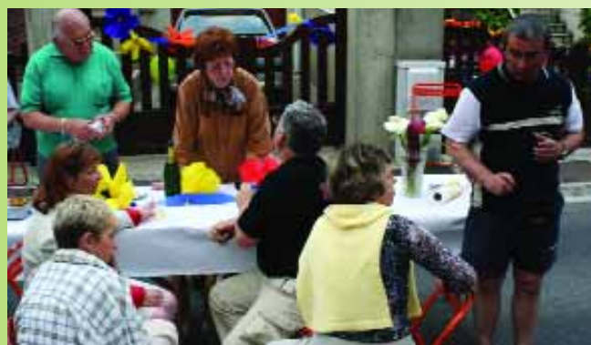
Rue Jean Jaurès