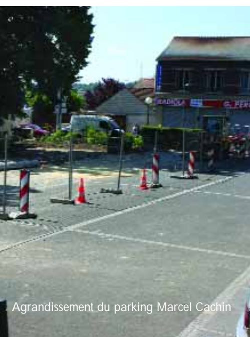
Agrandissement du parking Marcel Cachin

Pour tout complément d'information, n'hésitez pas à contacter les services techniques municipaux : 03 44 64 45 45