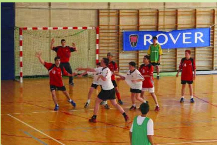
C'est l'équipe de Puteaux qui a remporté le challenge de Hand-ball des moins de 15 ans organisé par le hand-ball club de Montataire