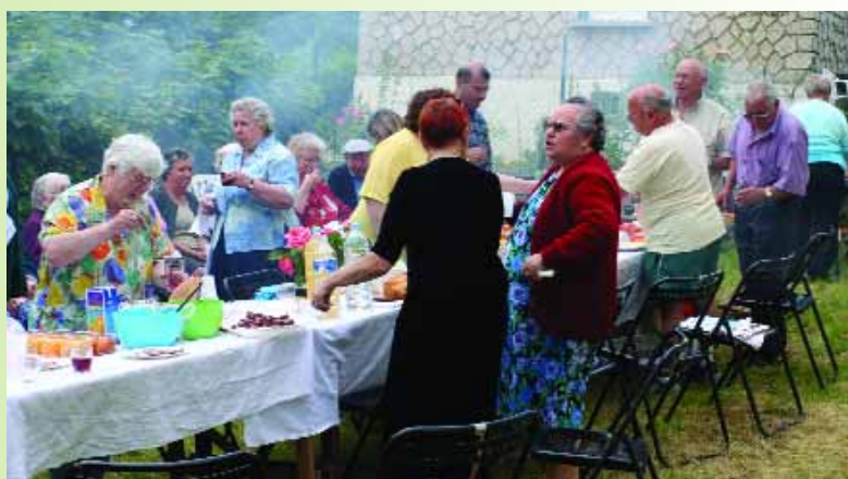
A la cité Jules Guesde