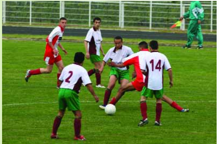
Tournoi de foot organisé par le club des Portugais de Montataire qui se sont inclinés en finale contre Persan