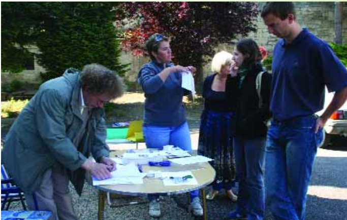
Les responsables de Mons ad Theram inscrivent les participants au rallye semi-pedestre qu'ils ont organisé pour la connaissance de notre ville